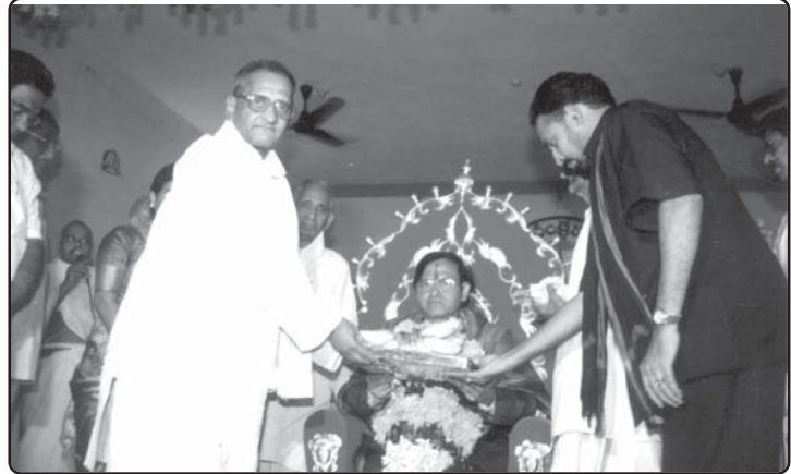
23-11-2003 తేదీ పాలకొల్లు క్షత్రియ సంక్షేమ పరిషత్ ఆధ్వర్యంలో కార్తీక సమారాధన సందర్భముగా