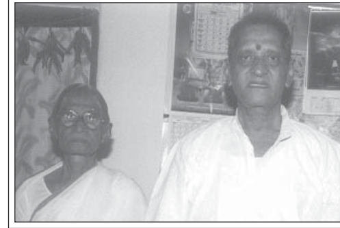
తల్లిగారితో శ్రీ నాన్నగారు