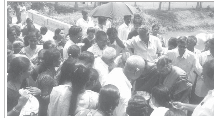
పూర్ణకుంభంతో కమిటివారు శ్రీ నాన్నగారిని ఆశ్రమానికి ఆహ్వానిస్తూ...