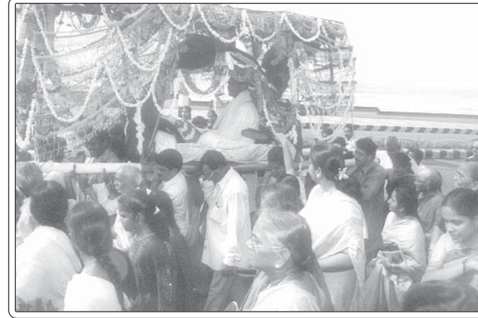
పల్లకి సేవ దృశ్యమాలిక